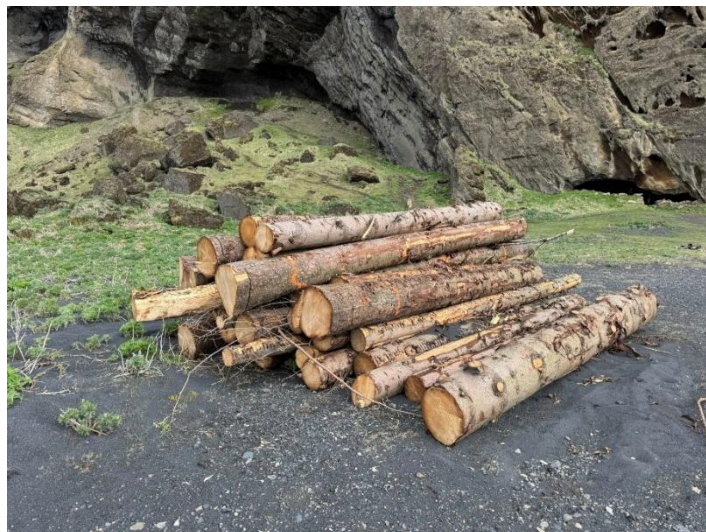
Grentitré úr Öskjuhlíðinni

Ferðin inn í Vík í Mýrdal er um 200 Km og tekur ca. 2 ½ tíma að keyra. Það eru tvö bílastæði við Hjörleifshöfðann, fyrra bílastæðið P1, þar er klósetaþstaða og myndarlegt Víkingaskip. Mikið af gönguleiðum og slóðum þar sem hægt er að ganga upp á Höfðann. Góður staður fyrir fjallageitur. Seinna bílastæðið P2 er svo fyrir endann á Höfðanum og þar er Yoda hellirinn ásamt fleiru skemmtilegu að sjá.