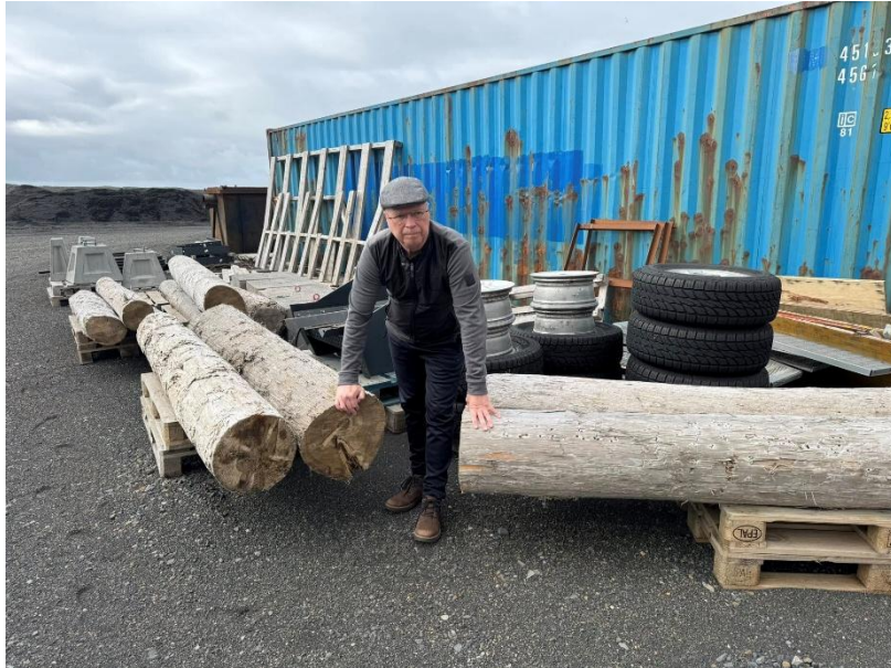
Rekaviður í Sandnámunni, rétt fyrir utan Vík.

Það er aðstaða í sandnámum rétt fyrir utan bæinn sem hægt er að vinna eitthvað, en ef veður er leiðinlegt, rigning og rok þá er lítið skjól nema fyrir þá allra hörðustu Víkinga. Sennilegt er að verkefnin verði unnin í bænum að mestu leiti.